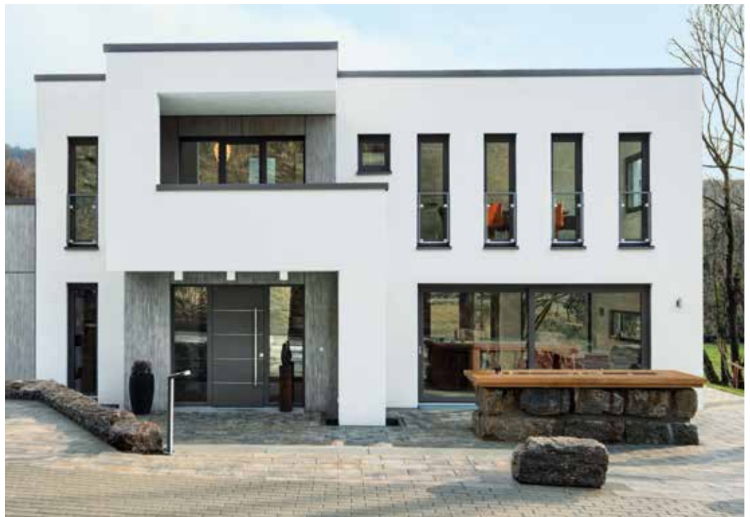
Schüco LivIng bildet die perfekte Grundlage für moderne, zeitgemäße Haustüren.

Eine Haustür ist die Visitenkarte eines Hauses und verleiht dem Eingangsbereich Charme und Ästhetik. Aber nicht nur optisch muss eine Haustür überzeugen. Funktionalität und Langlebigkeit stehen dabei ebenso im Mittelpunkt. Mit Schüco LivIng können Sie Ihre persönlichen Ansprüche in einer Tür vereinen. Gestalten Sie Ihre neue Kunststoff-Haustür ganz nach Ihren Vorstellungen und Wünschen. Gleichzeitig bietet Schüco LivIng eine innovative Technologie, die beste Wärmedämmung bis auf Passivhausniveau und erhöhten Einbruchschutz bis zur Widerstandsklasse 2 (RC2) ermöglicht.